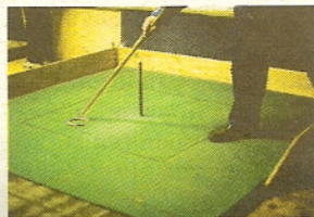
Det gäller att träffa pinnen

Det är nog ingen dum idé, tänker jag och ställer mig vid barnlinjen. Hela tre av mina fem hästskor träffar pinnen och jag är kolossalt nöjd. Ännu nöj-