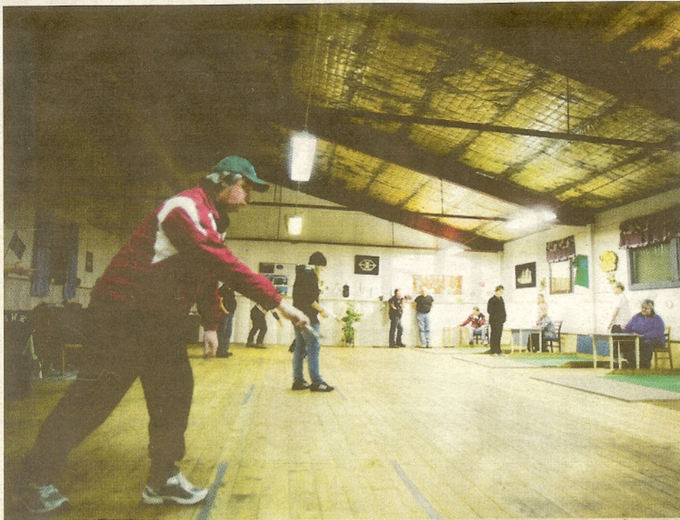
Det gamla sågverket i Väckelsång är träningslokalen som gäller på vintrarna för medlemmarna i Tingsryds Horse shoe club. På sommaren kastar man loss utomhus.